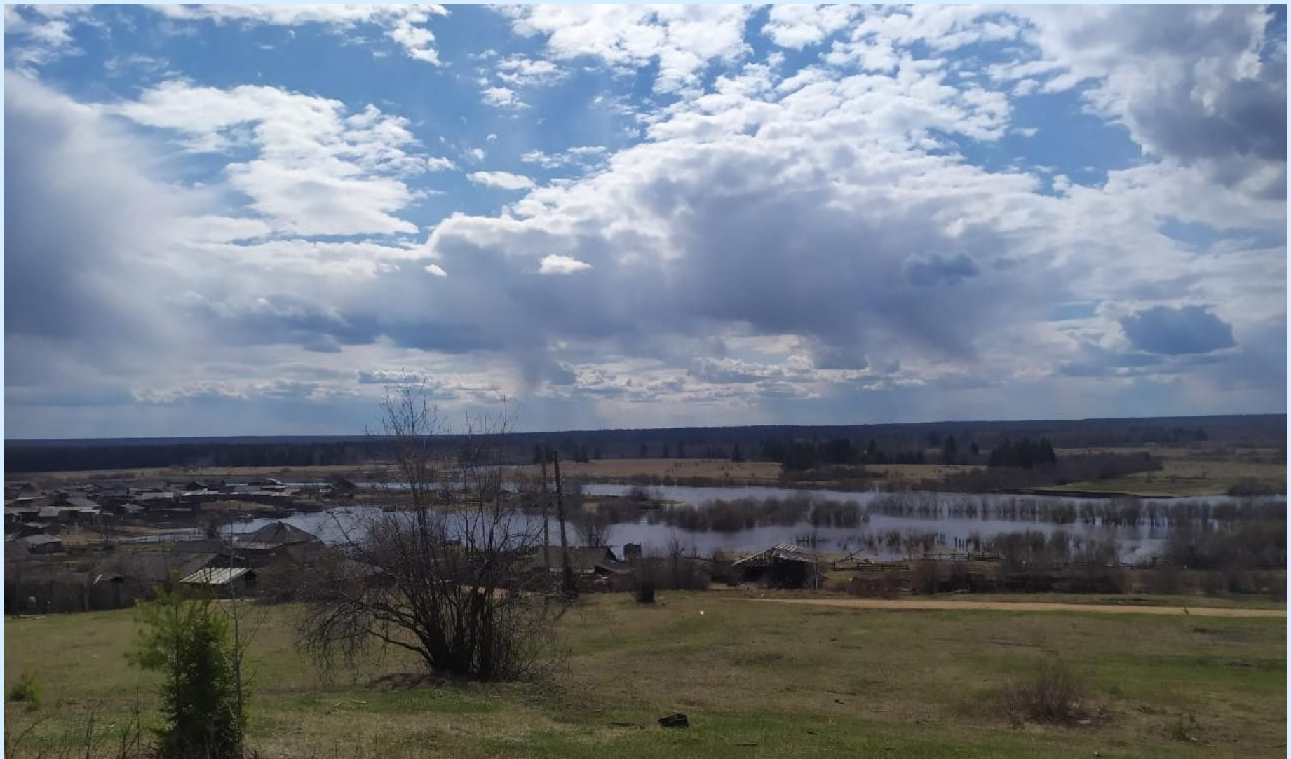
Моё село весной.