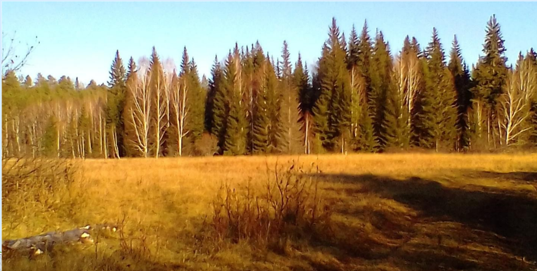
Дорога в лес через поле к Сергиеву урочищу.

С собой на прогулку я взяла фотоаппарат и на каждом шагу делала интересные снимки. Приглашаю вместе с нами вспомнить нашу прогулку и полюбоваться красотами нашего леса.