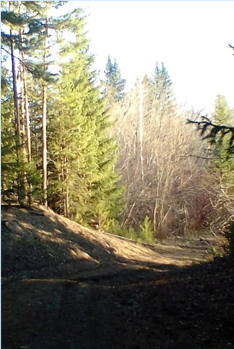
Тропинка по лесу к реке.